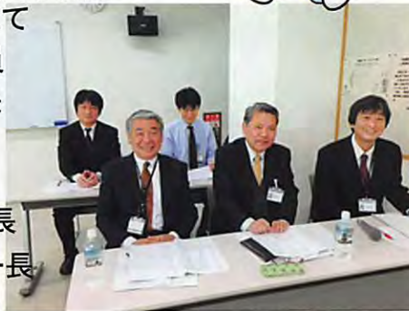
川越市関係部署の皆様