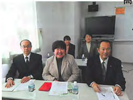
高階選出市議会議員の皆様

市議会議員 全員 川越市市民部部長 他 2 名 市民センター 大嶋前センター長 小谷野副センター長 高階支会役員他