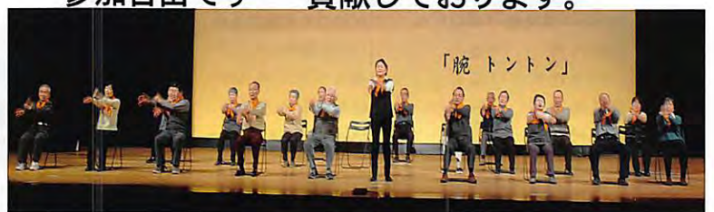
「地域で取り組む・介護予防」 平成27年3月25日 川越市民会館